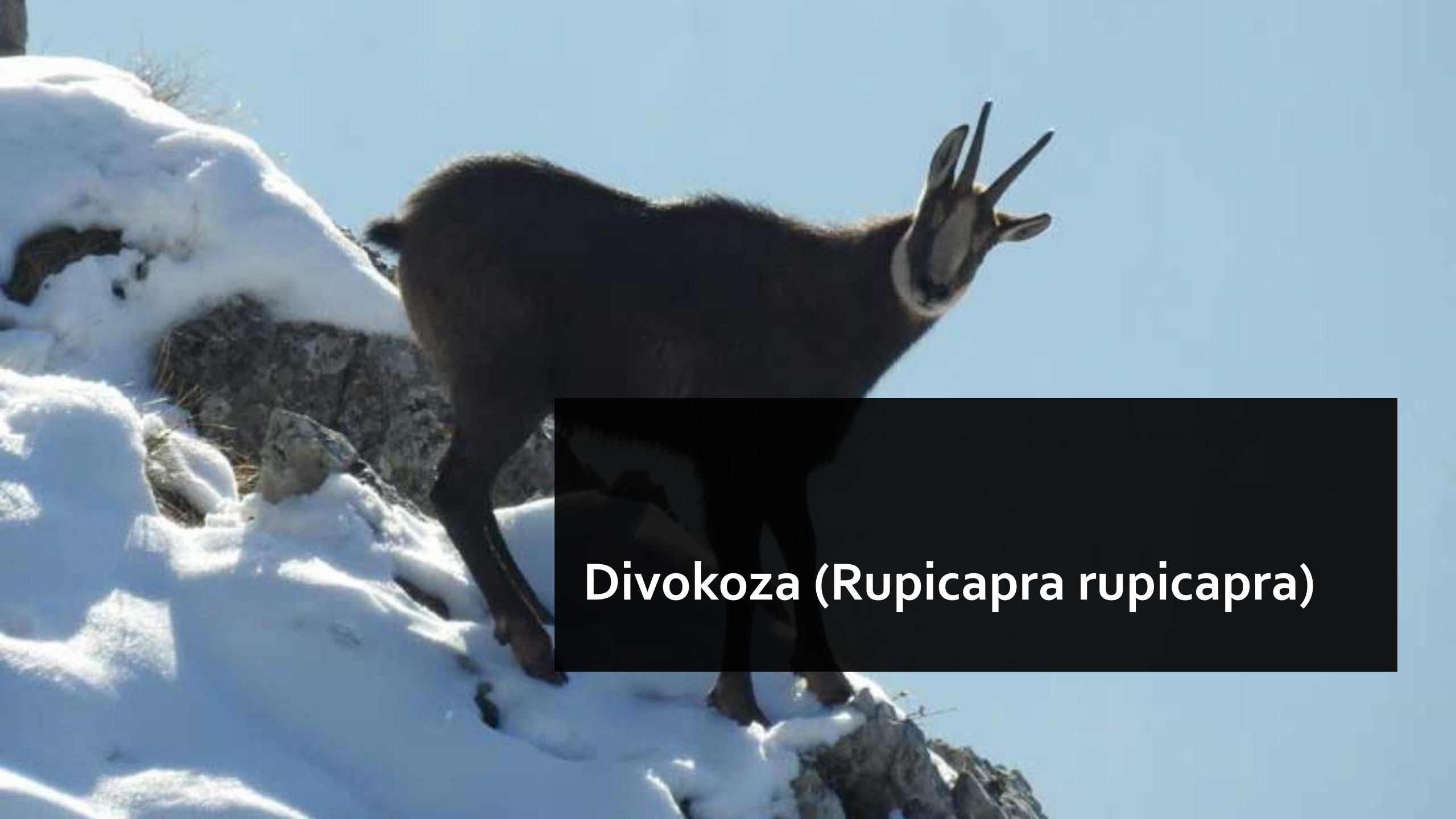
Divokoza ( Rupicapra rupicapra )