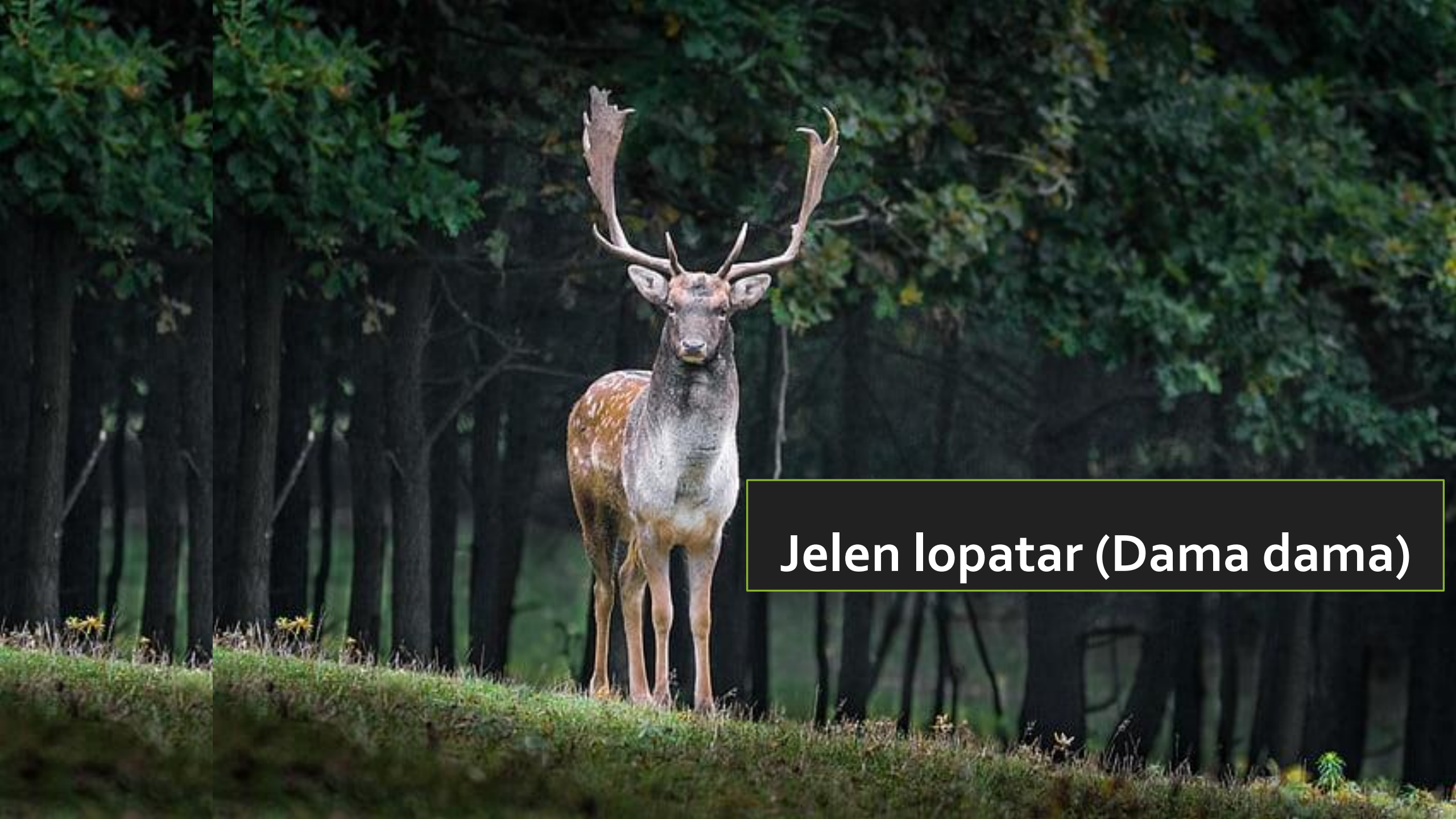
Jelen lopatar (Dama dama)