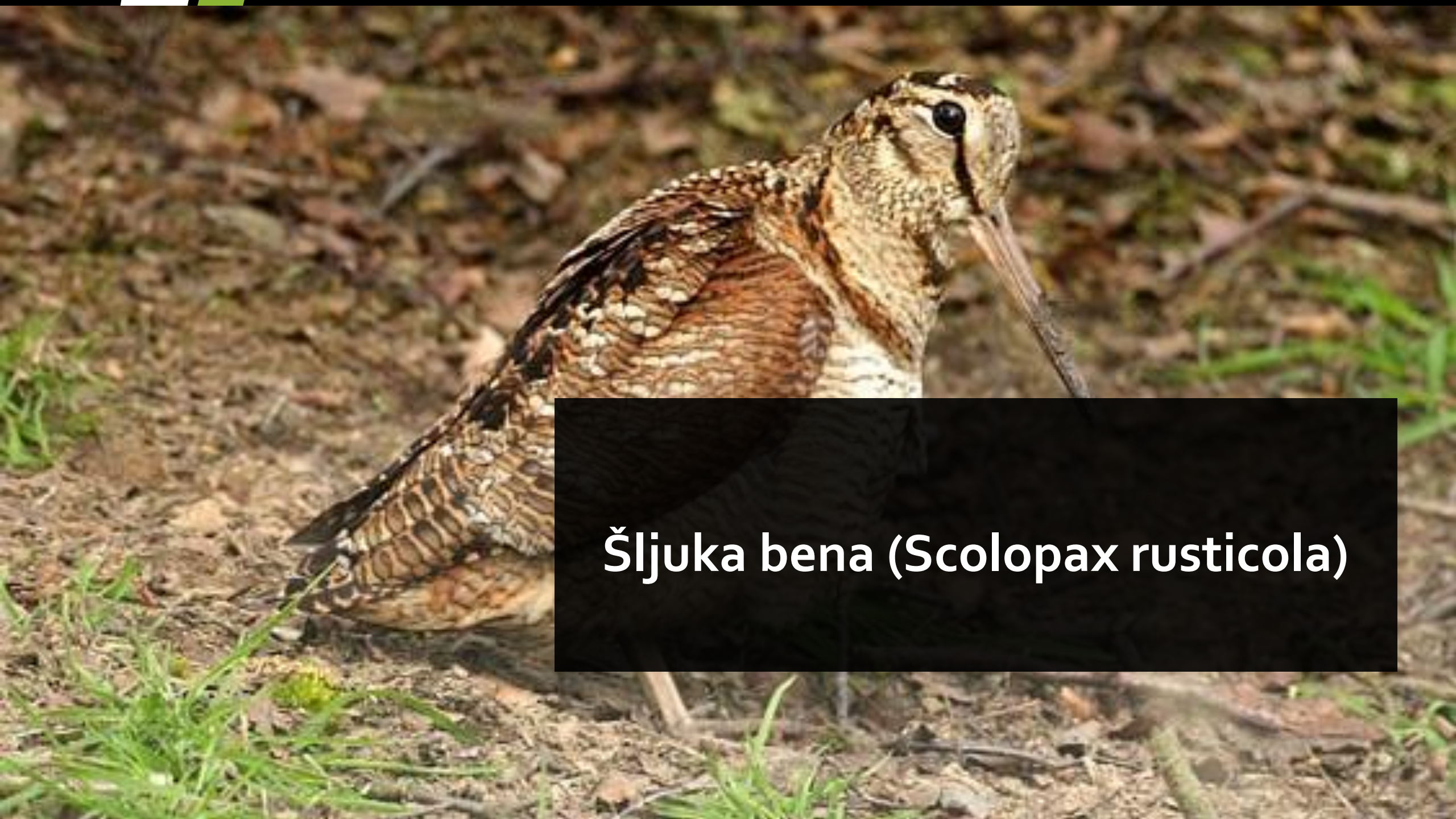
Šljuka bena ( Scolopax rusticola )