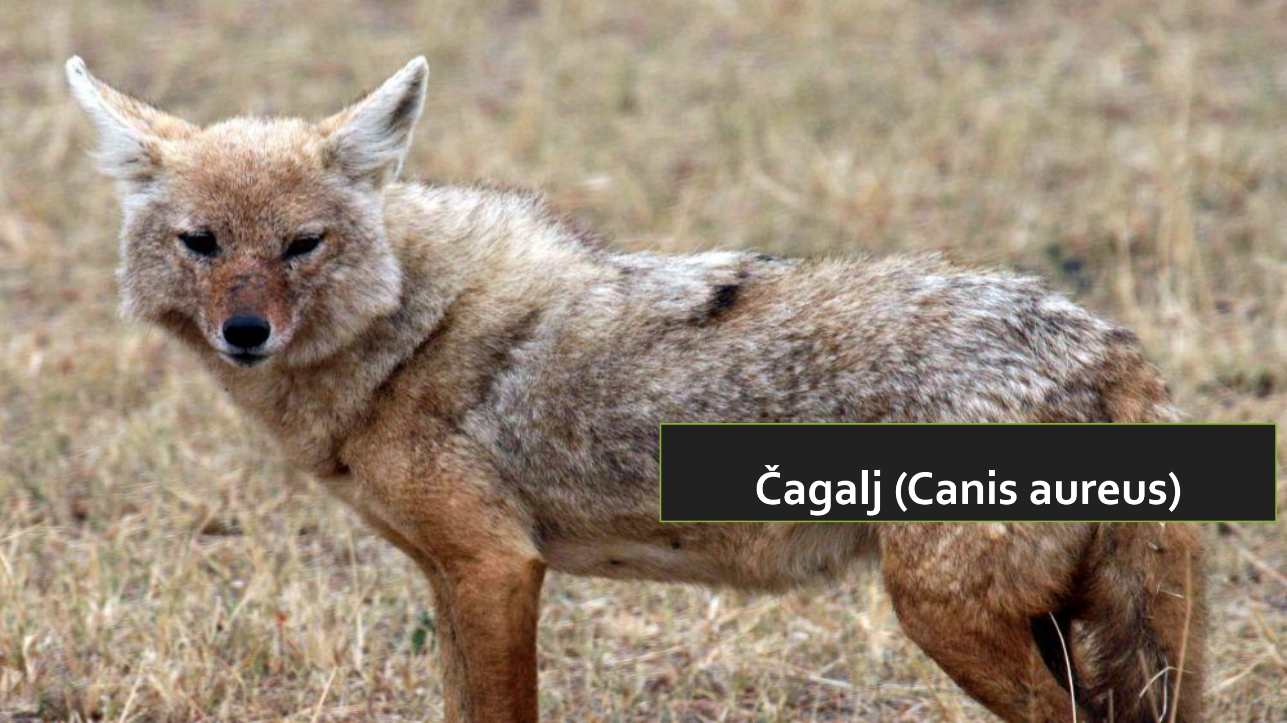
Čagalj ( Canis aureus )